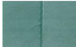
ROZDÍLY V ODSTÍNU